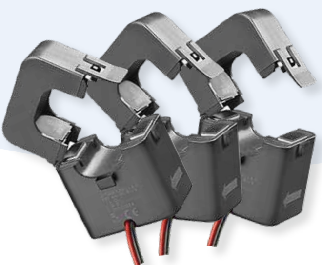
Current Transformer x 3