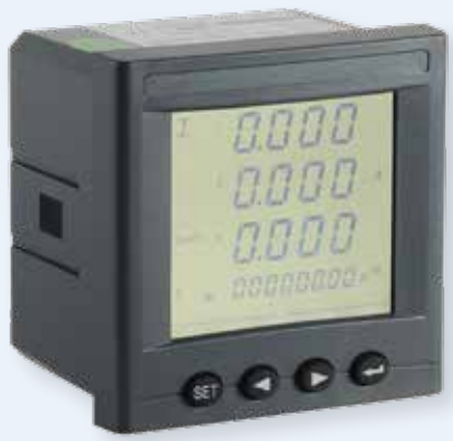
EPM-96 Power Meter