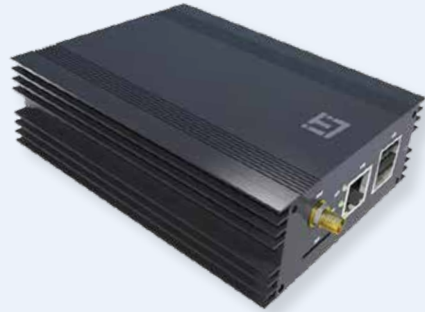
EPG-001 IIoT Gateway